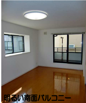
明るい南面バルコニー