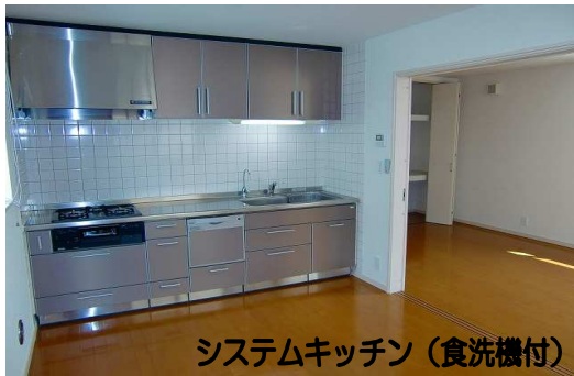
システムキッチン(食洗機付)

■物件概要 ■ ●所在地/川口市中青木3丁目 ●交通/JR京浜東北線「川口」駅徒歩21分、又は「西川口」駅徒歩18分 ●土地面積/141.27㎡(42.73坪) ●建物面積/105.79㎡(32.00坪) ●地目/宅地 ●土地権利/所有権 ●構造/木造コロニアル葺3階建 ●築年月/平成18年6月 ●用途地域/準工業地域 ●建ぺい率/60% ●容積率/200% ●設備/東京電力・都市ガス・公営水道・本下水 ●接道/東側7m公道 ●現況/空家 ●引渡し/即入居可 ●態様/媒介