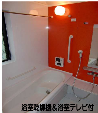
浴室乾燥機&浴室テレビ付